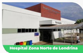
Hospital Zona Norte de Londrina