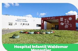
Hospital Infantil Waldemar Monastier