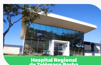
Hospital Regional de Telêmaco Borba