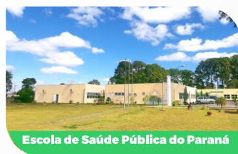
Escola de Saúde Pública do Paraná