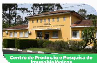
Centro de Produção e Pesquisa de Imunobiológicos