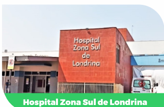
Hospital Zona Sul de Londrina