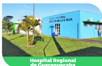
Hospital Regional de Guaraqueçaba