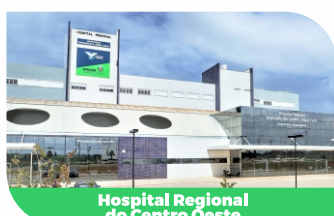
Hospital Regional do Centro Oeste