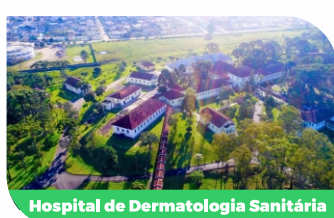
Hospital de Dermatologia Sanitária