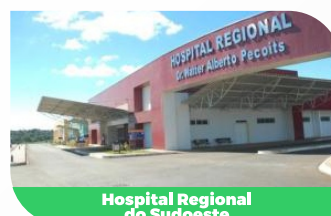
Hospital Regional do Sudoeste