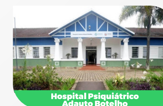
Hospital Psiquiátrico Adauto Botelho