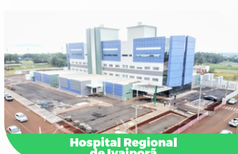
Hospital Regional de Ivaiporá