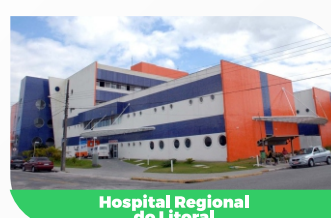
Hospital Regional do Litoral