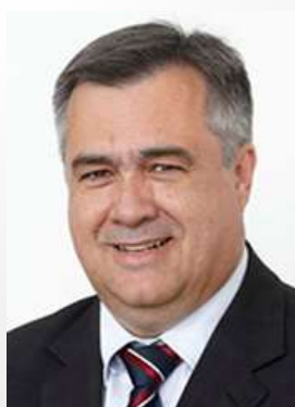
Secretário de Estado da Saúde do Paraná CARLOS ALBERTO GEBRIM PRETO