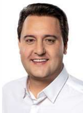
Governador do Estado do Paraná CARLOS MASSA RATINHO JUNIOR

coerência com as estratégias definidas pelo Poder Executivo. Para fins de supervisão, coordenação e fiscalização de suas finalidades, a FUNEAS é vinculada à Secretaria de Estado da Saúde, assegurando aderência aos princípios, normas e objetivos do Sistema Único de Saúde no âmbito estadual.