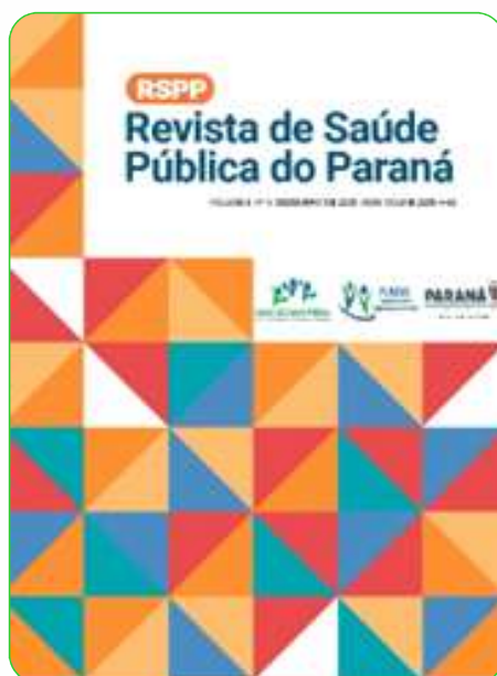
Revista de Saúde Pública do Paraná, v.8. n.4, dezembro de 2025.

Em 2025, a Revista de Saúde Pública do Paraná (RSPP) alcançou um patamar inédito de qualificação técnica ao ser selecionada como finalista para indexação na base LILACS. Em um processo altamente concorrido, a RSPP figurou entre os cinco periódicos brasileiros que chegaram à fase final de análise de mérito pelo Comitê de Avaliação. Embora a indexação plena aguarde a implementação de recomendações técnicas previstas para o ciclo de 2026, o desempenho na seletiva confirma que a revista já atende aos rigorosos padrões internacionais de qualidade exigidos pela BIREME/OPAS/OMS.